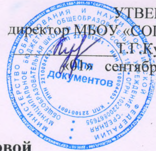
ГРАФИК питания учащихся в столовой 2023-2024 уч. год